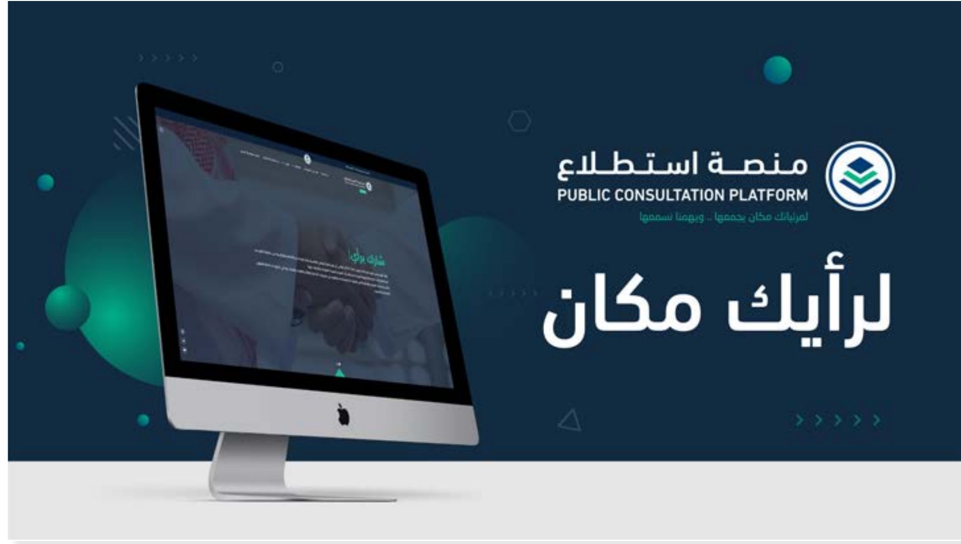
منصة استطلاع .. لرأيك مكان