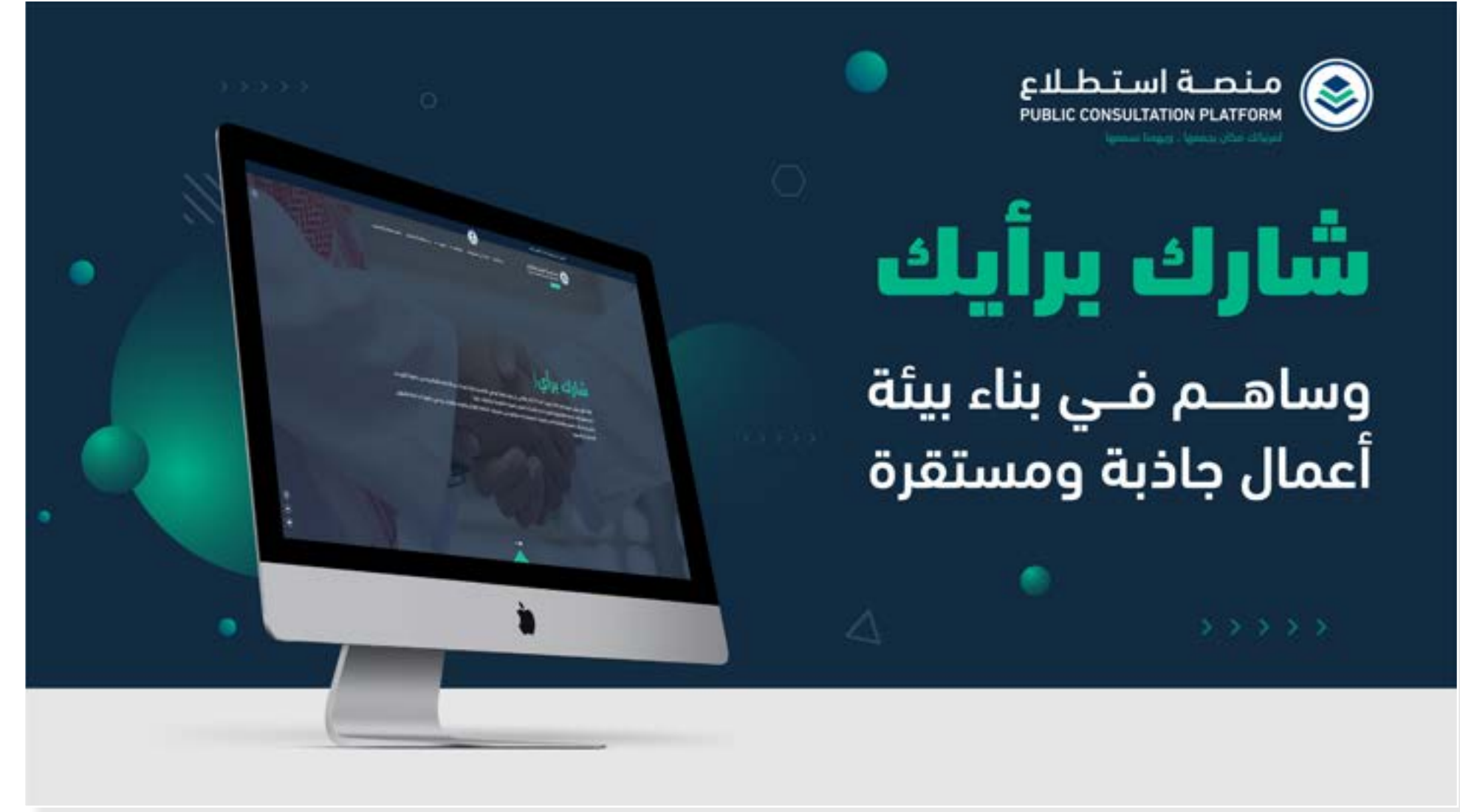
شارك برأيك وساهم في بناء بيئة أعمال جاذبة ومستقرة